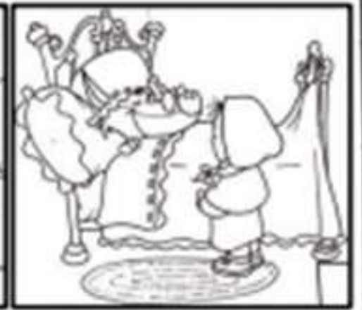
partes del cuento